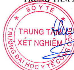
TS. Đặng Thế Hưng