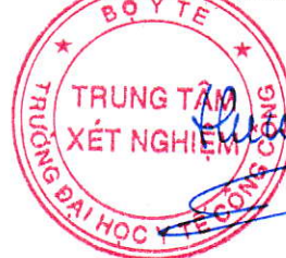
TS. Đặng Thế Hưng