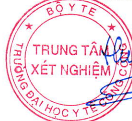
TS. Đặng Thế Hưng