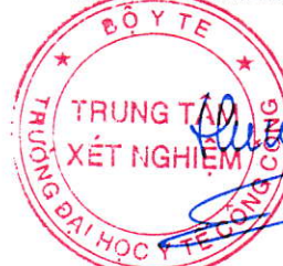
TS. Đặng Thế Hưng