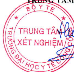
TS. Đặng Thế Hưng