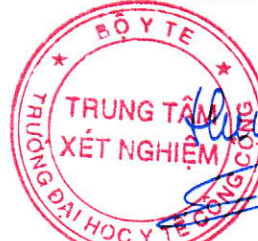
TS. Đặng Thế Hưng