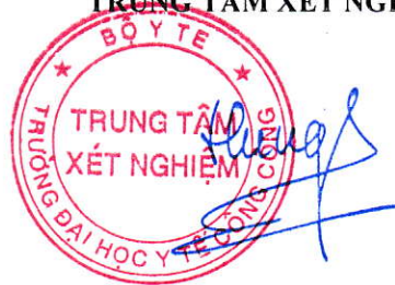
TS. Đặng Thế Hưng