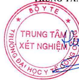
TS. Đặng Thế Hưng