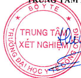
TS. Đặng Thế Hưng